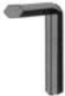
(C) Standard Sechskant-Schlüssel inklusive